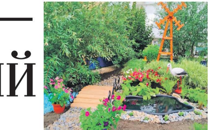
Рождественская школа Валуйского городского округа